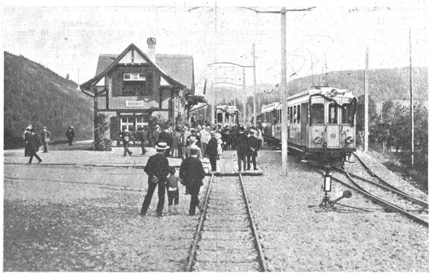
Zur Eröffnung der Worblentalbahn: Station Bolligen.

Die Verbindung nach Worblen dient in der Hauptsache dem Güterverkehr. Unter Benützung des Geleises der Zollikofen-Bernbahn werden die Waggon der Normalbahn auf sogenannten Kollischemeln in den Bahnhof Zollikofen transportiert, um von hier den Weg in die Welt zu machen. Die Linie nach der Papiermühlestraße, also in die Stadt, wird so gut wie ausschließlich dem Personenverkehr dienen. Bereits