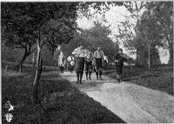
Auf der Landstrasse.

Wen unter uns Erwachsenen ergreift nicht die wehmutsvolle Sehnsucht nach den vergangenen Jugendentagen, wenn wir spielende, singende, wandernde Jugend begegnen? Die