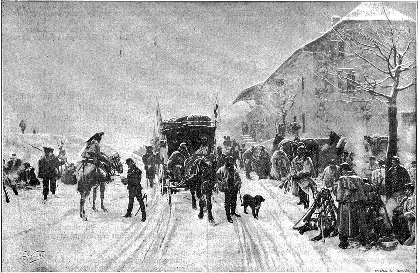
Ambulanzen in Verrières beim Uebertritt der Bourbaki-Armee über die Schweizergrenze im Winter 1871. Nach einem Gemälde von Ed. Castres.

dessen Vorsitz General Dufour übertragen wurde („Prof. C. Röhrlisberger in „Die Schweiz im neunzehnten Jahrhundert“). Bereits am 26. August des gleichen Jahres tagte unter dem Vorsitz des General Dufour im Athenäum in Genf die erste internationale Konferenz. An ihr nahmen von 14 Regierungen 18 amtliche Abgeordnete, 6 Delegierte verschiedener Vereine, 7 Fremde ohne besondere Vollmachten und 5 Genfer Mitglieder teil. „In zehn Resolutionen und drei Wünschen sprachen sie sich für die in jedem einzelnen Staate zu betreibende Gründung von Zentralausschüssen und Lokalsektionen zur friedlichen Vorbereitung aller Hilfsleistungen im Kriege aus und sodann für die Anbahnung eines allgemein verbindlichen Staatsvertrages behufs Neutralisierung des gesamten militärischen und freiwilligen Sanitätspersonals; als wünschenswert wurde die Einführung eines gemeinsamen Erkennungszeichens (Armbinde und Flagge) für die Sanitätskorps, Ambulanzen und Spitäler genannt und aus Dankbarkeit gegenüber der Schweiz, welche in dieser Sache den Weg gewiesen, das rote Kreuz im weißen Felde als solches bezeichnet.“