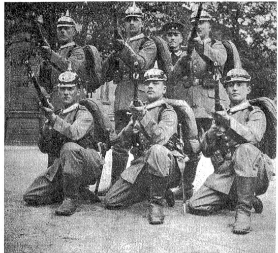
Deutsche Militärbilder: Garde-Füsiliere.

Und unter Verwünschungen oder Tränen, unter Bitten