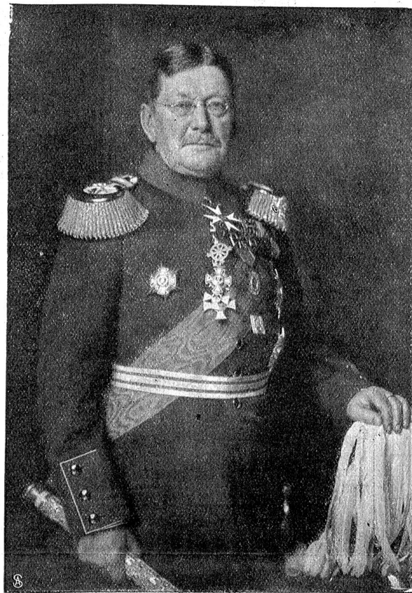
Feldmarschall Frhr. von der Goltz, deutscher Gouverneur von Belgien.

in eine einzige Festung verwandelt. Ein siegreiches Oesterreich wird mit seiner künftigen Balkanpolitik über die Interessen des „gewesenen“ Bundesfreundes zur Tagesordnung schreiten. Die italienische