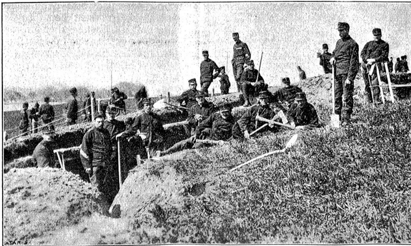
Eine Sapeur-Kompagnie bei der Anlage von befestigten Infanterie-Stellungen.