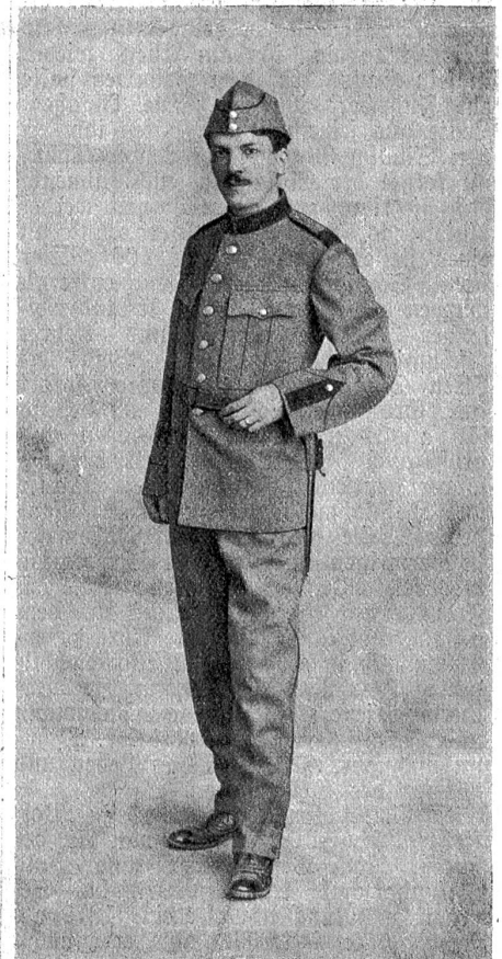
Schweizerischer Infanterist in der neuen feldgrauen Uniform.

Es verlautet, daß die französische Regierung, auf die falschen Anschuldigungen im „Gaulois“ gestützt, wonach die Schweiz an Deutschland Getreide abgebe, Hafer und Weizen, den der schweizerische Privathandel aus Amerika angekauft, in Marseille angehalten habe. Schon verladene Ware mußte wieder ausgeladen werden. Hoffentlich gelingt es unserer Behörde, die Franzosen vom