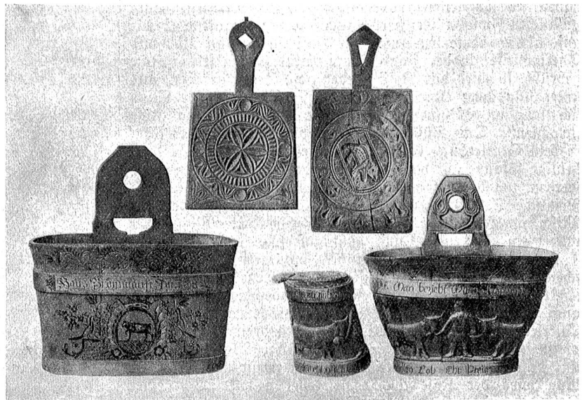
Butterbretter und Milchgefäße mit Kerbschnitt und Relieffschmuck.

Wenn die Milch geronnen ist, so nimmt der Käser ein säbelförmig zugeschnittenes Holz, den „Schludfabel“, löst damit die geronnene Masse vom Kessel und beginnt den „Schlud“ zu brechen“, indem er mit dem Säbel die Masse kreuz und quer durchschneidet und nachher mit dem „Brecher“ darin rührt. Der Brecher ist ein kleines Lännchen, das samt den Nesten entrindeet wurde. Die Nester werden eingebogen und die Spitze in ein in den Stamm gebohrtes Loch gezogen, so daß jeder Ast einen vom Stamm abstehenden Bogen bildet. Indem der Senn mit diesem Instrument die Masse rührt, wird der Schlud in immer kleinere Teile geteilt, bis der ausgeschiedene Käsestoff schließlich nur noch in flockigen Teilchen in der gelblichen „Sirmende“ (Sirte) schwimmt. Die Kunst bei dieser Verrichtung besteht darin, die Flocken möglichst gleichmäßig und der dem Charakter