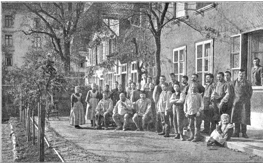
Zöglinge des Blindenheims an der Neufeldstrasse in Bern.