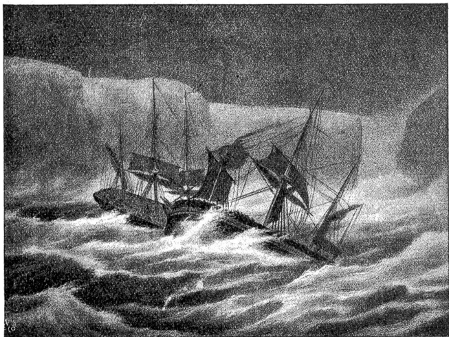
Der Zusammenstoß von Erebus und Tenor mit dem Eisberg, 13. März 1842

englische, eine schottische und eine schwedische Expedition im ewigen Eise des Südpols. Die englische Expedition unter