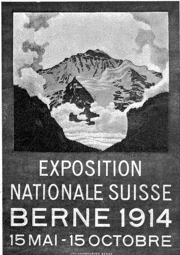
Das neue offizielle Plakat der Schweiz. Landesausstellung 1914 von Plinio Colombi, das nach Frankreich verschickt wurde an Stelle des zurückgewiesenen ersten Plakates von Emil Cardinaux.

„Muescht halt go sueche“, rät trocken der Bauer und zuckt die Achseln. „I cha nüt derfür.“ Dann behändigt er das Leitseil und fährt kaltblütig davon.