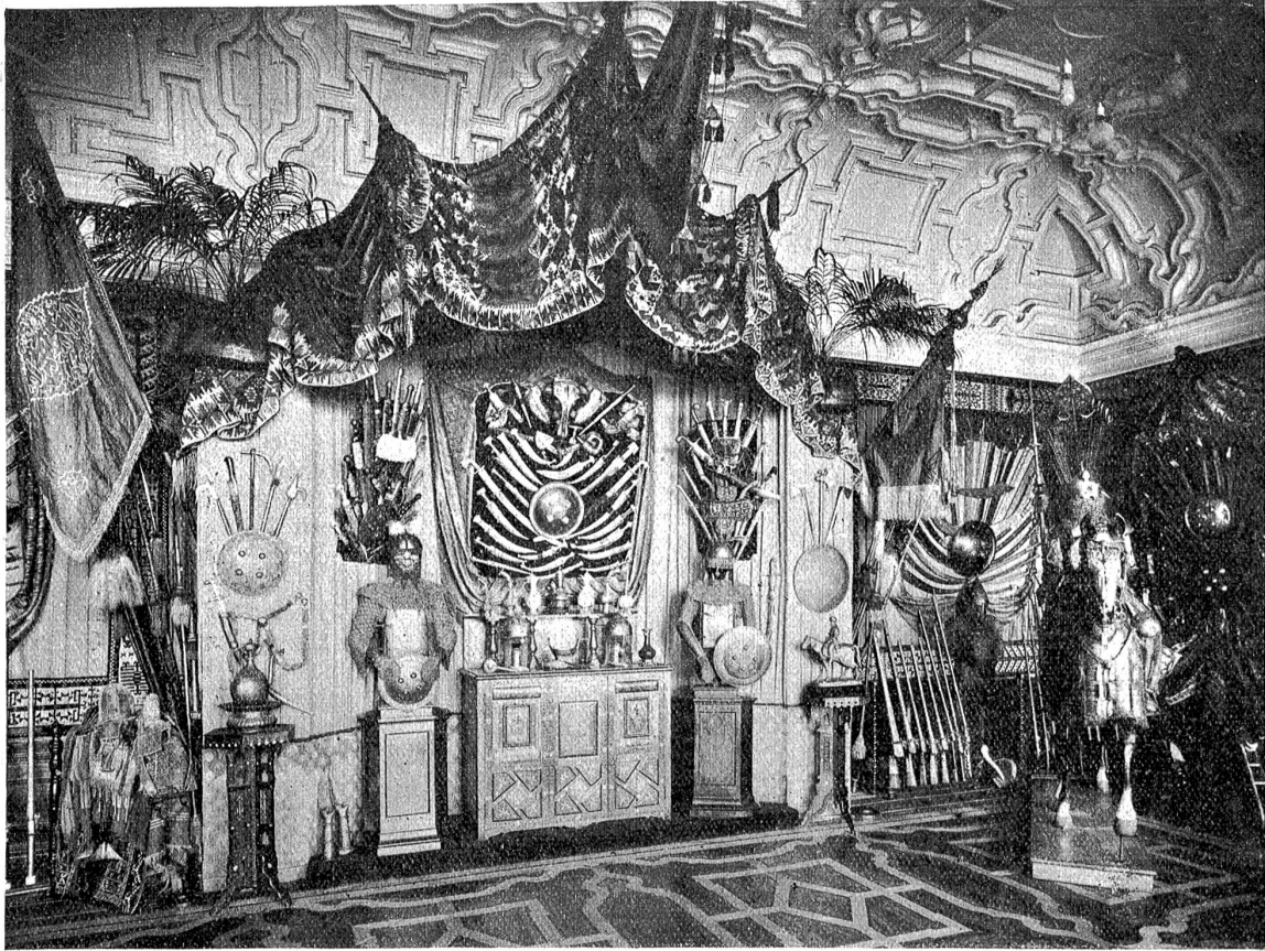
Ansicht des Waffensaaes auf Charlottenfels.

im Aeußern der vollendete Weltmann und Kosmopolit, in seinem Innersten der bescheidene und tüchtige Schweizer geblieben ist und der nun in Bern, seiner neuesten Heimat, den Ort gefunden hat, wo er seine Schätze am besten aufgehoben glaubt. Und darin soll er nicht enttäuscht werden.