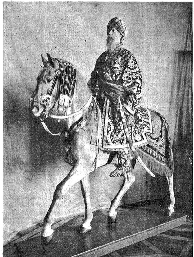
Reiter von Buchara.