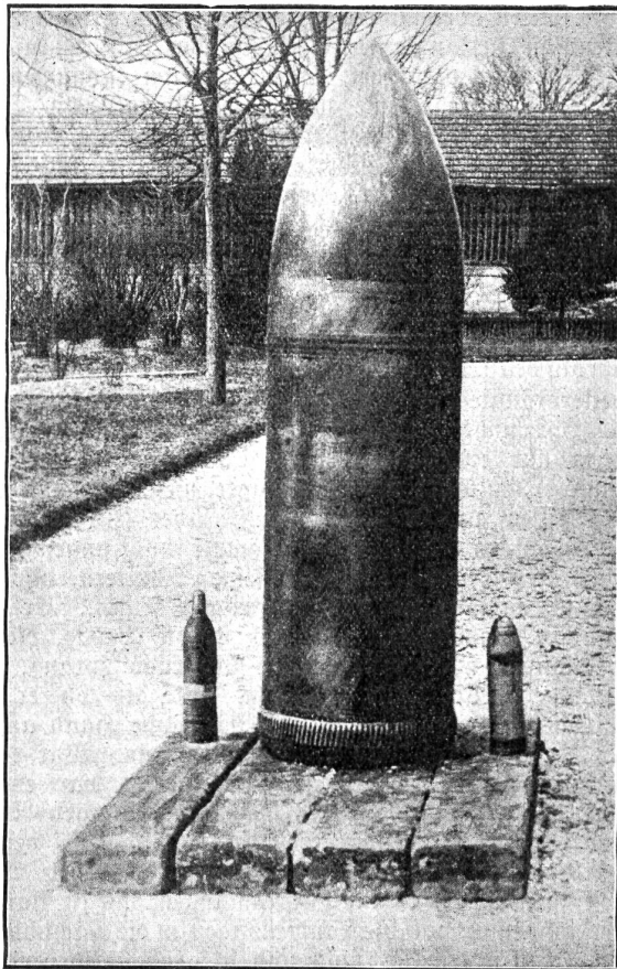
Ein 42-cm Geschöß der deutschen 42-cm Mörser, welches ohne zu krepieren, niedergegangen ist. Daneben steht ein französisches 7,5-cm Geschöß.

unsere Schulweisheit nichts träumen läßt. Der Teil ihrer Bewohner, der beim Schichtwechsel um die Mittagszeit die Werkstätten verläßt, überflutet im Nu die Straßen Essens mit einem unabsehbar, schwarzen Gewimmel, durch das sich die Straßenbahnen nur mit ewig heiserer Glocke mühsam den Weg erzwingen. Ich sehe eine Frau unter die Räder eines Fuhrwerks kommen. Ein kleiner Kreis bildet sich um sie, die Massen wälzen sich aber hastig weiter, zu kostbar ist die Zeit. Hier wird jede Minute mit Gold aufgewogen wie draußen im Felde mit Blei. Die ruhigen Stirnen heben sich nicht zu dem diesigen Himmel, die müden Augen haben keinen Blick für die Romantik der Stahlzeit, die Ohren hören nicht die revolutionären „Schritte der Arbeiterbataillone“ — alt und jung strömt hinaus in den Frieden vor den Toren, in die Blumenidyllen der Heimstätten, die ihnen der Mann geschaffen, der vor seine Tat das Wort stellte „Der Zweck der Arbeit soll das Gemeinwohl sein“. Mit den Gehenden mischen sich die Kommenden, Essen kennt keine träge Mittagsruhe. Ich tauche mit ihnen unter in das brüllende, heulende, stampfende und dampfende, dröhnende, stöhnende Chaos des maschinenerfaßten Eisens, in den herrlichen Feuerzauber unserer Tage, in das Schattenreich der Kohle. (Schluß folgt.)