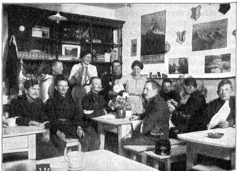
Soldatenstube Nr. 54 im Cessin.

„Als im November letzten Jahres einige Damen des Verbandes Soldatenwohl damit begannen, im Jura für die Truppen Soldatenstuben einzurichten, da hat keine von