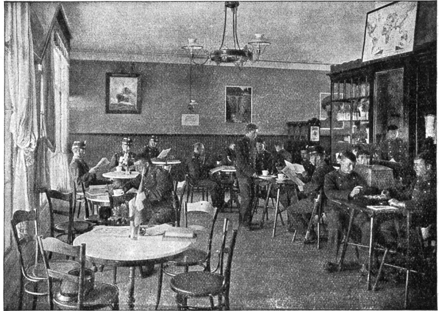
Soldatenstube Nr. 103. Eine fremden-Confiserie.

Es ist natürlich zu sagen, daß wir vom Armeestab und von den Divisionskommandanten von Anfang an sehr viel Entgegenkommen und Hilfe erhielten; diese Herren haben uns manchen Weg geebnet und manche Schwierigkeiten aus dem Wege geräumt. Wir haben allerdings lernen müssen, mit den primitivsten Mitteln auszukommen. Unsere Mittel waren anfänglich so knapp, daß wir in den ersten vier Wochen mit Schulden wirtschafteten. Aber mit einem glücklichen Idealismus hofften wir auf die so notwendigen Mittel und wirklich, unser Glaube wurde nicht zuschanden. Die innert drei Wochen eingerichteten dreißig Soldatenstuben erbrachten rasch den Beweis, daß wir die Sache praktisch angefaßt hatten und daß das Werk lebensfähig war. In vielen Ortschaften waren es wirklich die einzigen heimeligen Räumlichkeiten. Wir statteten die Soldatenstuben mit Büchern, Tageszeitungen, Zeitschriften, Spielen und Schreibmaterial aus. Seit April werden nun sämtliche Soldatenstuben mit Büchereien der Schweizerischen Soldatenbibliothek, die unter der Leitung von Herrn Hauptmann Wirz steht, ausgerüstet. Schöne Bilder, von Ge-