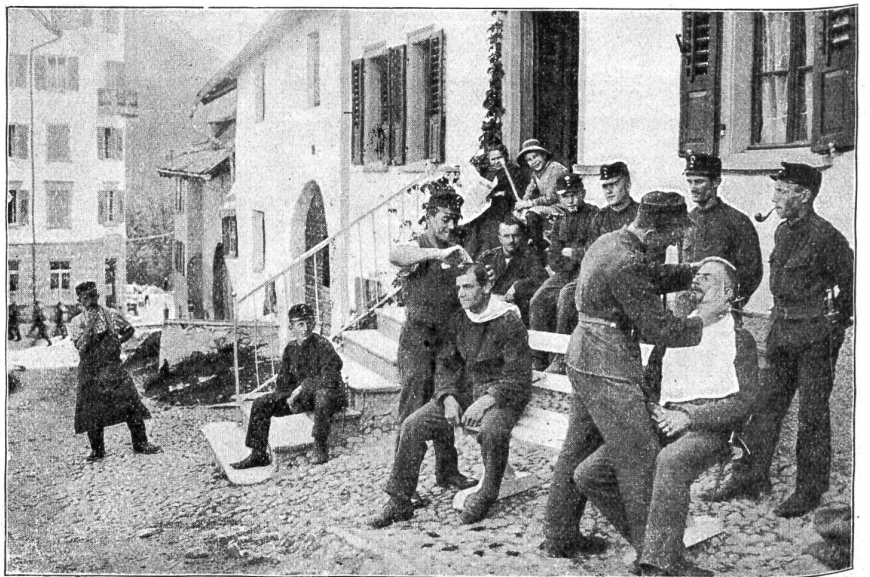
Beim Verschönerungskünstler.

mußten, nun aber mit Böden, Licht und Herd, ja sogar mit hängendem Grün und Bilderschmuck ein ganz trauliches Ansehen gewonnen haben. Und dann gilt's, die Stube ebenso sauber zu erhalten. Sauber in mehr als einer Beziehung. „Versteht die wohl auch Spässe?“ fragte zuerst zweifelnd der eine oder andere, auf die Leiterin deutend, die sich keineswegs immer durch Runzeln und graue Haare von vornherein als Muetterli ausweist. „Freilich!“ lacht dieses freundlich, „aber nur die guten Spässe versteh ich.“ So blieb es denn bei den guten. — „Sie ersparen uns Disziplinarfälle, diese Stuben, mehr vielleicht als man so denkt,“ sagte mir ein Oberst, der es nicht verschmäht, auch einmal am saubern Brettertisch Kaffee und Apfel-