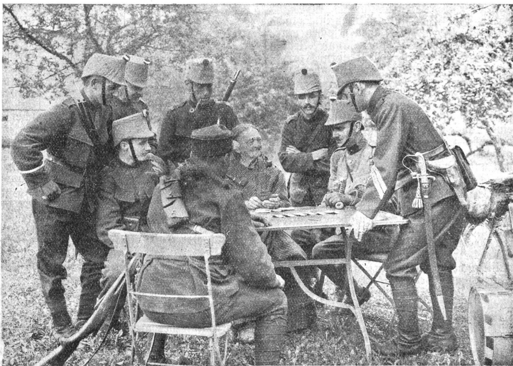
Wahrsagerin bei unseren Cruppen im Jura.

Man vernimmt aus dem Bundeshaus, daß man dort gedenkt, den Preistreibern mit den Kartoffeln dadurch ent-