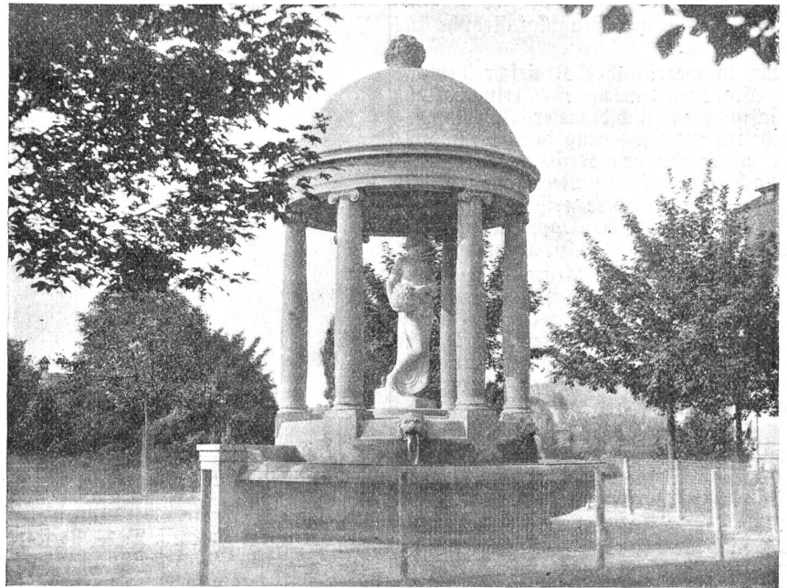
Ein glücklicher Gedanke war es, den Monumentalbrunnen, der während der Schweiz. Landesausstellung vor dem Restaurant „Studerstein“ stand, unserer Stadt zu erhalten. Er steht heute in reizvoller Umgebung auf der Promenade südlich des Monbijou-Schulhauses, Ecke Sulgeneckstraße-Schwarztorstraße.

Wie seinerzeit gemeldet, hat der amerikanische Gesandte in der Schweiz, M. Pleasant Stovall in Bern, die in der Schweiz lebenden Amerikaner aufgefordert, Beiträge zu einem der Schweiz zu schenkenden Soldatenheim zu sammeln. Dieser liebenswürdigen Einladung ist ein amerikanischer Bürger, Herr Carlos Lembke in Cadex, in der Weise nachge-