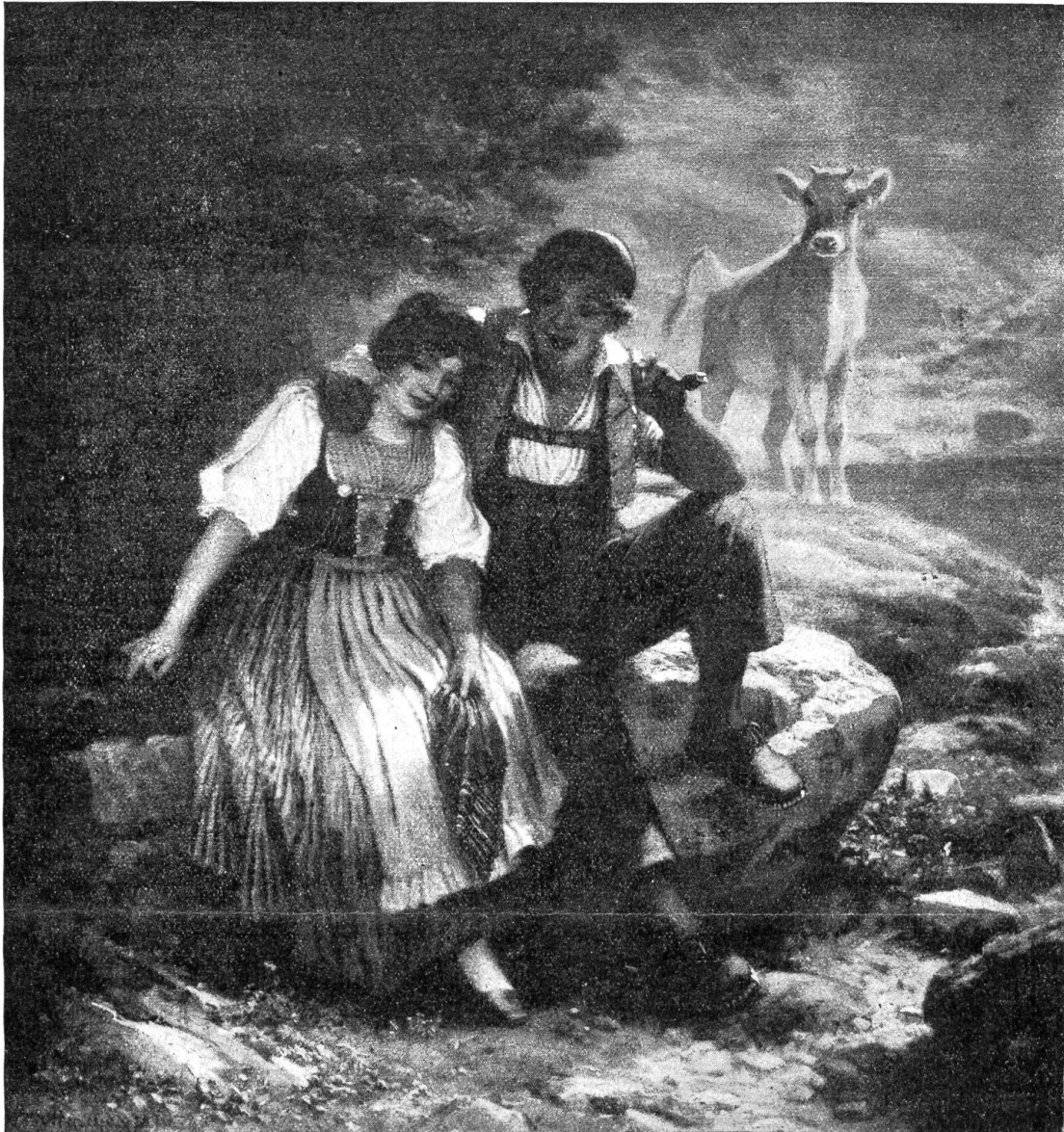
Belauscht. Oelgemälde 1874