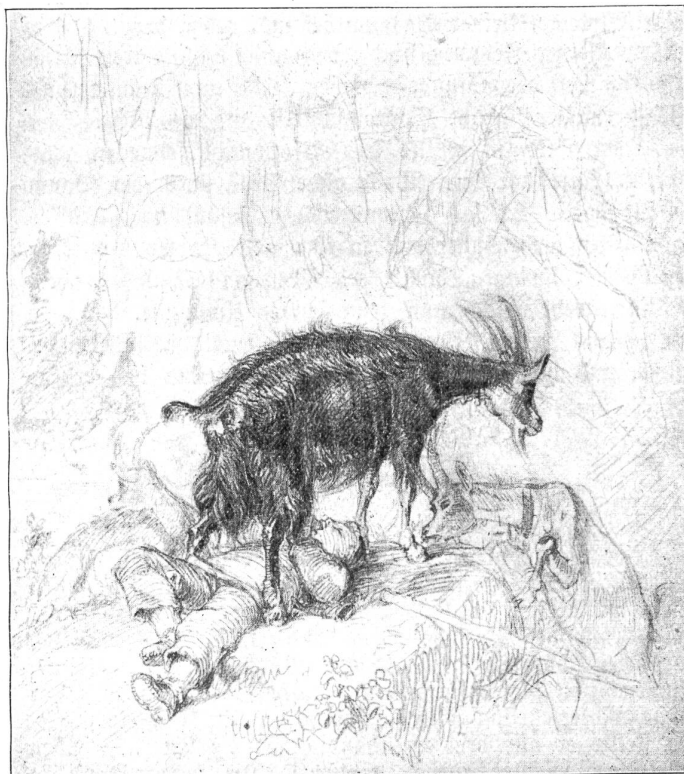
Crinkender Ziegenhirt. Bleistiftskizze.