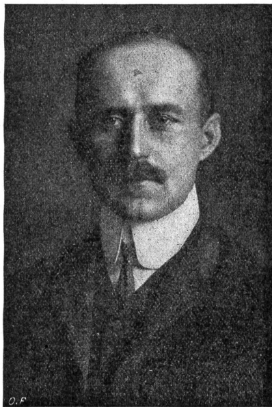
Dr. Adolf Föhr, der neue Generaldirektor der Schweiz- Nationalbank in Bern.

Die schweizerische Postverwaltung nimmt wieder eine Anzahl Postlehrlinge an. Die Bewerber haben sich bis spätestens 15. Dezember 1915 schriftlich bei einer Kreispostdirektion anzumelden. —