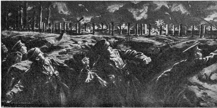
Englische Infanterie verteidigt einen durch Stacheldraht geschützten Schützengraben durch Handgranaten.