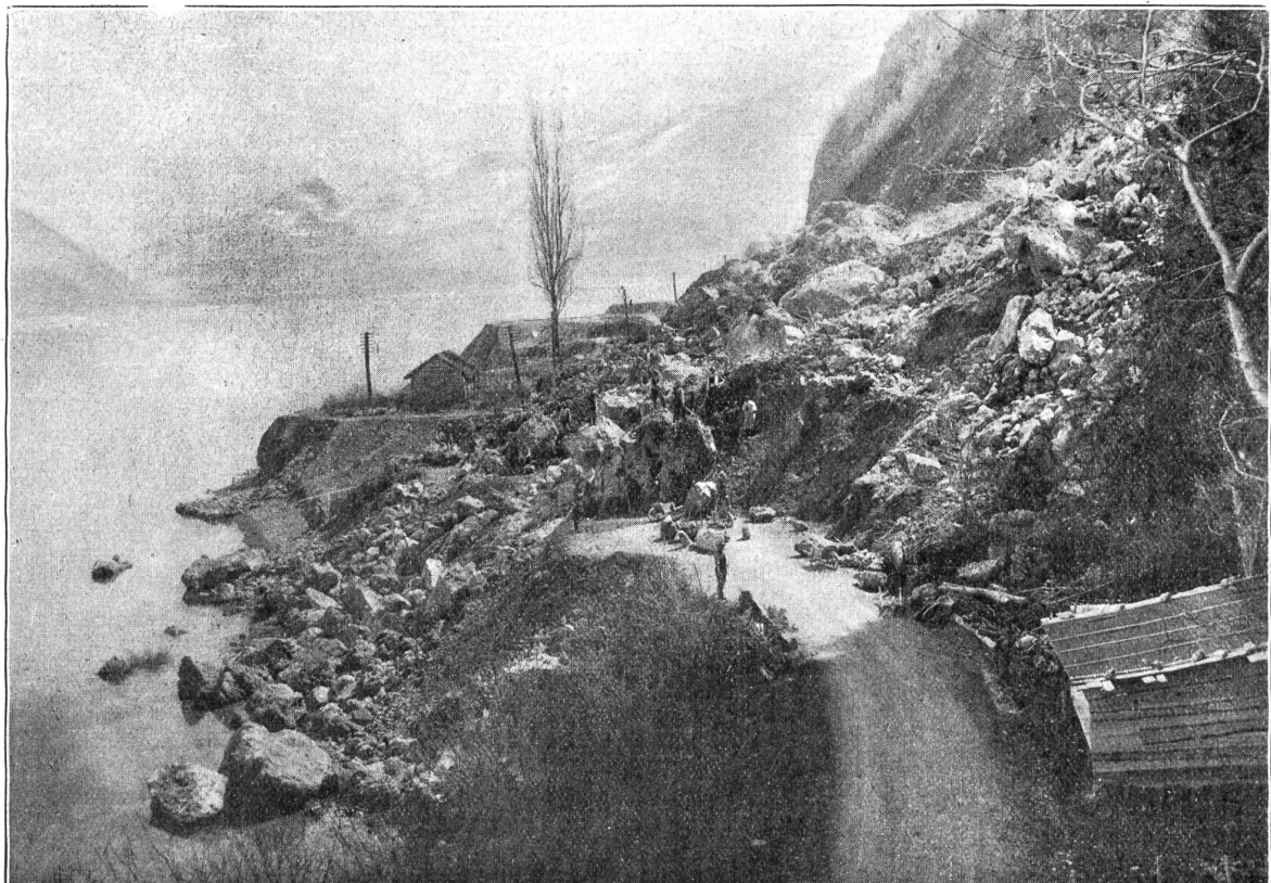
Der Bergrutsch zwischen Faulensee und Leissigen am Chunersee.

In Anbetracht der gegenwärtigen Lage hat das Armeekommando die Aufhebung folgender 14 Preßkontrollbureaux vom 1. Mai abhin verfügt: Lausanne, Neuenburg, Freiburg, Bern, Biel, Aarau, Solothurn, Luzern, Zürich, Win-