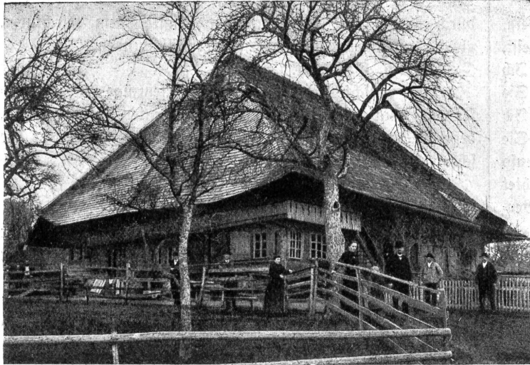
Bauernhaus in Brüggelbach, Neuenegg.

Die vier alten Landgerichte Sterneberg, Seftigen, Zollikofen und Ronolfingen, welche Bern nach allen vier Him-