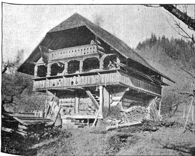
Speicher in Rüegsau, 1749.

Unter dem großen Strohdach war ursprünglich alles ein großer, unabgeteilter Raum, mitten unter dem Dachbalken der Feuerherd, als Sammelplatz der Familie, und nahe dabei an den Wänden die Lagerstätten für die Nacht, der übrige Raum diente teils als Stallung für Roß und Rind und