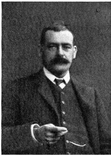
† Max Buri.

Buri ist ein Meister des Stillebens. Mit der Bonne des Künstlers und Könners stellt er die Blumentöpfe vors