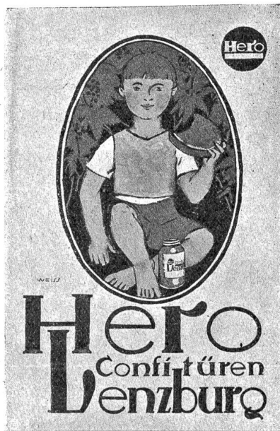
Werk-Wettbewerb. 4. Preis, Fr. 50, Motto: „Weiß“, von O. Baumberger, Zürich.

des Ostens schätzt und selbst mit leuchtenden Farben einen harmonischen Eindruck zu geben weiß. Wer daraufhin die beiden erstprämiierten Lösungen der Konkurrenz, von O. Baumberger, Zürich, und K. Kösch, Dießenhofen, betrachtet, der wird die Erwartungen in schönster Weise erfüllt finden. Ich freue mich darauf, das leuchtende Rot der Türkenhosen mit dem Schwarz als Gegenpart, die vornehm verteilte Schrift in einer Serie von Blättern an der Wand zu sehen. Und wie werden die Farben von Karl Kösch als noble Erscheinung mitten unter den schreienden Kino- und Blankoplataten als etwas Zutruenerweckendes dastehen. Ein Briefkopf, eine Hausmarke, ein Plakat und nicht zuletzt die Annonce der Tageszeitung erziehen in einer vornehm sachlichen Lösung immer eine sicher wirkende Empfehlung, die Vertrauen erweckt. Wer die Inseratenseiten unserer Zeitschriften und Zeitungen, wer die Plakatwände betrachtet, der wird gewahr werden, daß diese Ueberlegung mehr und mehr für den Kaufmann und bei den Kunden erst recht Geltung findet.