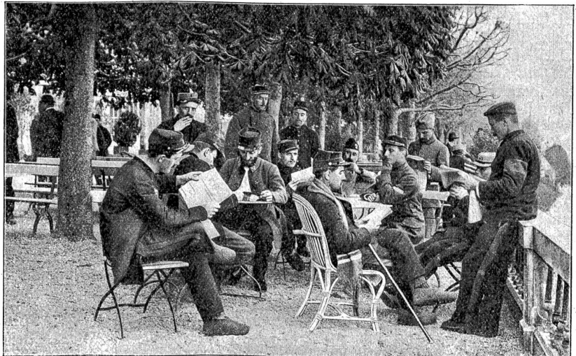
französische kranke Internierte in Magglingen ob Biel.

Die Auswahl der Internierten in den Gefangenenlagern geschah durch Kommissionen, die aus je zwei Schweizerärzten und einem Militärarzt des betreffenden Staates bestand. Diese Kommissionen begannen ihre Arbeit am