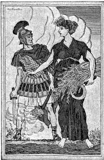
Bundesfeierkarte 1916, entworfen von Henri Claude Forestier, Genf.

Die Adressseite ist von Kunstmaler Moys Balmer in Luzern gezeichnet; sie enthält nebst dem Text eine Vignette, das Bild des Bruders Klaus, eine Mahnung zur innern Einigkeit. Die beiden Karten sind in Farbenlithographie ausgeführt von den Zürcher Firmen Art. Institut Drell Fühli und Gebr. Frey. — Neben den beiden Postkarten gelangen die gleichen Motive auch als Gedenkblätter in Folioformat zu Fr. 3.— zum Verkauf. Der Reinertrag beider Ausgaben ist nach dem Beschluß des Bundesrates zur Unterstützung schweizerischer Wehrmänner bestimmt, die infolge des Wehrdienstes in finanzielle Not geraten sind. Freiwillige Gaben zu vaterländischen Zwecken nimmt das Bundesfeierkomitee durch alle Schalter der Schweizerischen Volksbank entgegen, die in hochherziger Weise bereits einen Betrag von 5000 Fr. gezeichnet hat. Auch andere Bankinstitute leiten solche Gaben weiter; ferner können freiwillige Einzahlungen auf den Postscheck des Schweizerischen