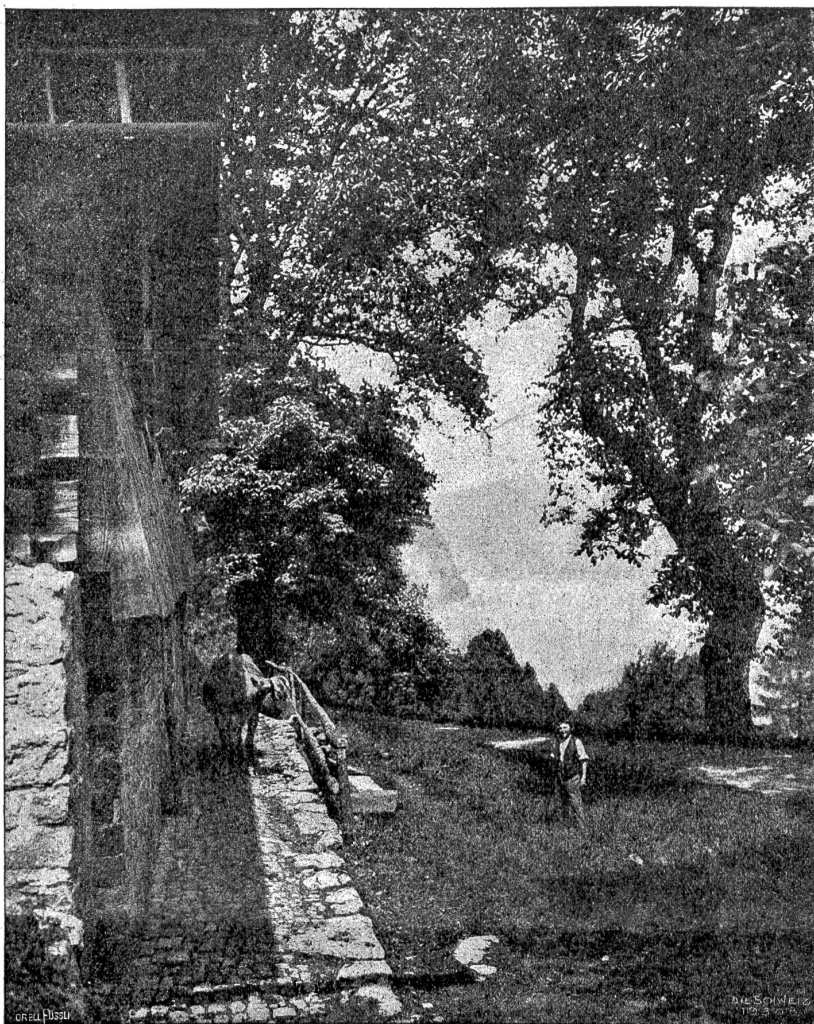
Auf dem Rütli.