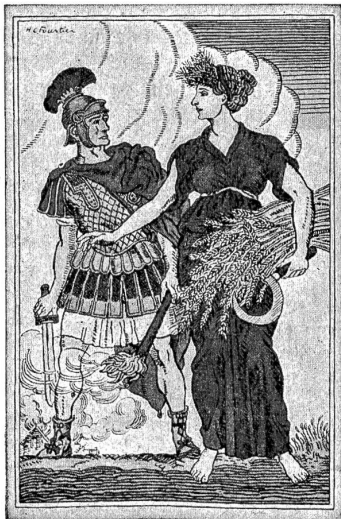
Bundesfeierkarte 1916, entworfen von Henri Claude Forestier, Genf.

Die Adressseite ist von Kunstmaler Moys Balmer in Luzern gezeichnet; sie enthält nebst dem Text eine Vignette, das Bild des Bruders Klaus, eine Mahnung zur innern Einigkeit. Die beiden Karten sind in Farbenlithographie ausgeführt von den Zürcher Firmen Art. Institut Drell Fühli und Gebr. Frey. — Neben den beiden Postkarten gelangen die gleichen Motive auch als Gedenkblätter in Folioformat zu Fr. 3.— zum Verkauf. Der Reinertrag beider Ausgaben ist nach dem Beschluß des Bundesrates zur Unterstützung schweizerischer Wehrmänner bestimmt, die infolge des Wehrdienstes in finanzielle Not geraten sind. Freiwillige Gaben zu vaterländischen Zwecken nimmt das Bundesfeierkomitee durch alle Schalter der Schweizerischen Volksbank entgegen, die in hochherziger Weise bereits einen Betrag von 5000 Fr. gezeichnet hat. Auch andere Bankinstitute leiten solche Gaben weiter; ferner können freiwillige Einzahlungen auf den Postscheck des Schweizerischen