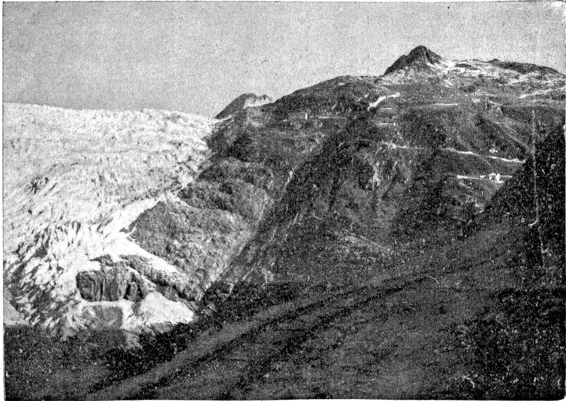
Von der Furkabahn. Der Rhonegletscher mit Furkastrasse und Hotel Belvédère.