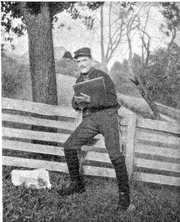
Der Fremdenlegionär. Internierter in Weissenburg. (Zeichner von Beruf.)

zige ihm bekannte deutsche Brocken dazwischen! Oh, was habe ich gelacht!