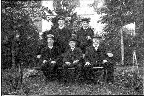
Pensionäre der Anstalt.

wieder geweckt, der Heilung von innen heraus die Wege gebahnt. Dabei wird jede Aufdringlichkeit vermieden; man schlägt sich nicht mit Lehrsäzen und Moralpredigten herum, man lebt vielmehr praktisches Christentum. Jede rechte Trinkerheilstätte bildet ein Bollwerk im Kampfe gegen den Alkoholismus. Noch viel zu wenig werden die Bemühungen der „Nüchtern“ um die Trinkerwelt gewürdigt. Das Geld, das für eine Kur ausgelegt wird, trägt reichliche Zinsen. Auch den Unbemittelten ist es möglich gemacht, die Anstalt