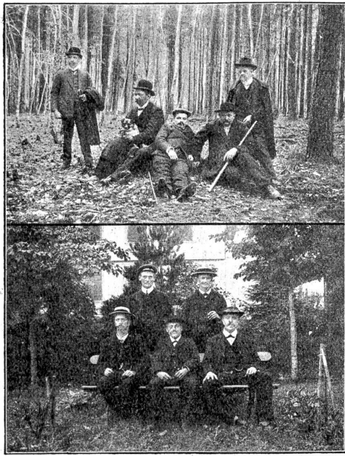
Pensionäre der Anstalt.

der franke Körper wird während einer Enthaltenskur gesund, sondern auch der Geist, das religiöse Leben wird