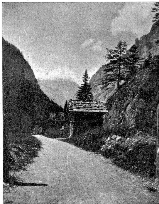
Talboden des Gasterntales. Im Hintergrund ist die Felswand sichtbar, an der der Gemmipass in 35 Windungen hinansteigt.