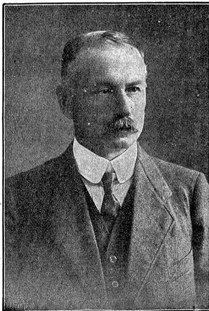
Arthur Couchepin, der neugewählte Bundesrichter.

Die Zentralstelle für Kohlenversorgung der Schweiz in Basel hat aus eingehenden Strafaeldern 4000 Fr. dem Fonds für kranke Schweizerwehrlänner, 4000 Fr. den Soldatenstuben