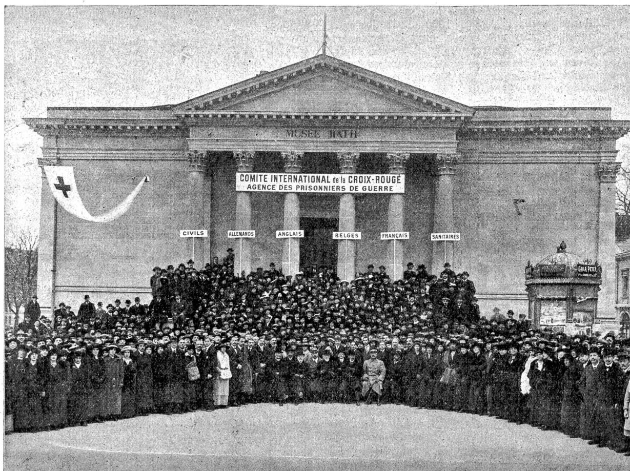
Das Personal der Internationalen Agentur für Kriegsgefangene vor dem Museum Rath in Genf.

ihren Gefangenenlagern zurückbehielten, diese den Vorschriften der Konvention entsprechend in ihre Heimatländer zurückkehren lassen. Jede humanitäre Bestrebung wird von dem Komitee unterstützt, und es nimmt ihre Organisation, wenn nötig, in die eigene Hand, so z. B. die Internierung der Kranken in der Schweiz.