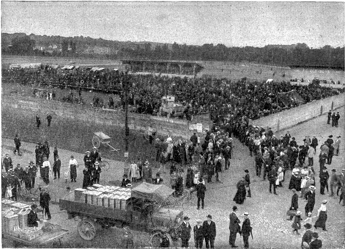
Heimtschaffung der Italiener: Auf der Margarethen-Wiese in Basel wurden in den ersten Augusttagen Tausende von heimkehrenden Italienern verpflegt.

sich in unserem Vaterlande, wenig beachtet und übertönt von den alarmierenden Nachrichten der sich jagenden Kriegserklärungen, rührende Szenen reinsten Menschlichkeit ab. 100,000 Menschen nach ungefähre Schätzung gab man Obdach und Speise. Trotzdem die Bahnen durch unsere Mobilisation in Anspruch genommen wurden, gelang es, sie weiter zu befördern. In Chiasso zeigte sich das Bild des Jammers am erschütterndsten; denn dort stauten sich die Massen der Unglücklichen, weil die italienischen Bahnen, vom Andrang überrascht, völlig versagten. Tagelang mußten die Emigranten vor den Toren ihrer Heimat warten.