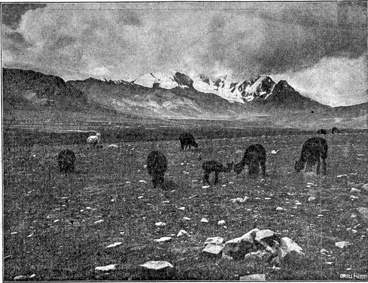
Punalandschaft; im Vordergrund Alpacas und Vicunjas (wilde Lamas).

eine einzige Karte und gewann, mußte gewinnen, denn sie liebte ja wie ich. Wäre es aber anders gewesen, ich hätte allem ein Ende bereitet, das war mein fester Entschluß.“