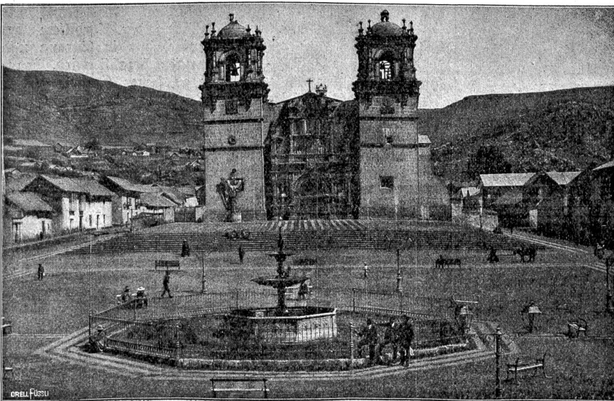
Platz vor der Kathedrale in Puno.