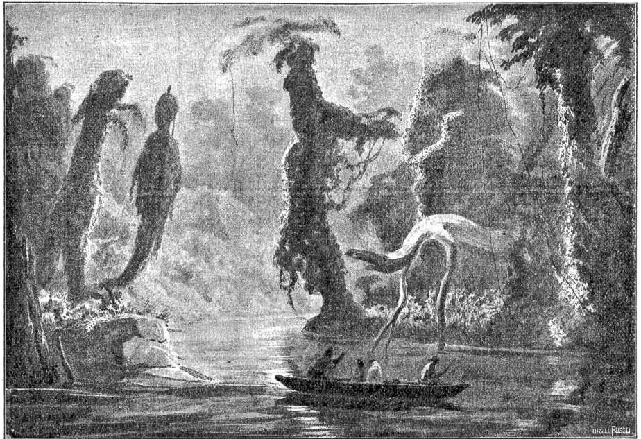
Mündung des Cahockiaflusses in den Mississippi.

ihm nicht gegönnt. Bern, das gerade damals die heftigsten politischen Kämpfe durchmachte, hatte wenig Verständnis für eine Indianer-Galerie, die Kurz malen wollte. Es blieb ihm nichts anderes übrig, als eine Stelle als Zeichnungslehrer an der Kantonschule anzunehmen; man mag sie übrigens dem Manne, der so ganz unbürgerliche Erlebnisse gemacht hatte und für ein damaliges Philologenherz grauenhafte Urteile fällte — „überhaupt waren die alten Griechen nur Indianer!“ sprach er einmal —, ungerne genug anvertraut haben. Als er im Jahre 1871 starb, hatte es das Schicksal gewollt, daß der Mann, dessen Sinnen in die weite Welt hinausgegangen war, zuletzt als ein ziemlich abgeschlossener und verhärmteter Mann gelebt hatte. Es besteht ein Selbstbildnis von ihm; er hat sich hier in Jägerkleidung neben einem schönen indianischen Rassepferd gemalt.