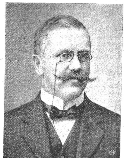
Edmund Schultheß, Vizepräsident des Bundesrates pro 1916.

Von den Aufsichtsorganen ist entdedt worden, daß von Privaten über die Festzeit viel Weißmehl, bzw. Teige, die aus Weißmehl hergestellt wurden, den Bäckereien zum Baden und Verarbeiten gebracht worden sind. Das Schweizerische Militärdepartement bringt daher seine Verfügung vom 1. September 1915 allen in Erinnerung: „Die Verwendung von Weißmehl oder einer Mischung von Weißmehl mit Vollmehl ist gestattet zur Herstellung von Kleingebäck aller Art