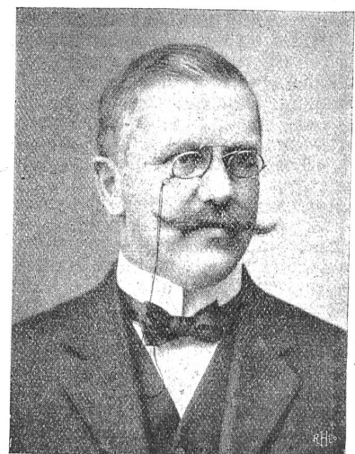
Edmund Schultheß, Vizepräsident des Bundesrates pro 1916.

Von den Aufsichtsorganen ist entdedt worden, daß von Privaten über die Festzeit viel Weizmehl, bzw. Teige, die aus Weizmehl hergestellt wurden, den Bäckereien zum Baden und Verarbeiten gebracht worden sind. Das Schweizerische Militärdepartement bringt daher seine Verfügung vom 1. September 1915 allen in Erinnerung: „Die Verwendung von Weizmehl oder einer Mischung von Weizmehl mit Vollmehl ist gestattet zur Herstellung von Kleingebäck aller Art