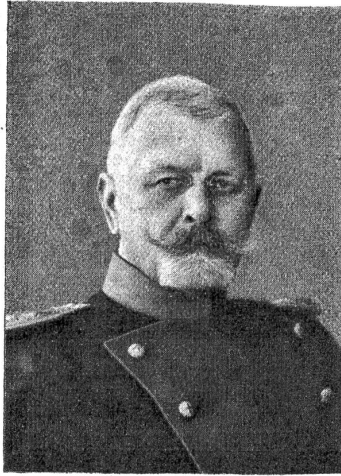
† Oberst Traugott Markwalder.

und Kommandant der Kavalleriebrigade 4, und im selben Jahre folgte die Ernennung zum Waffenschef der schweizerischen Kavallerie, welche Stelle er bis 1903 innehatte. Als Instruktor leitete Oberst Markwalder hauptsächlich die