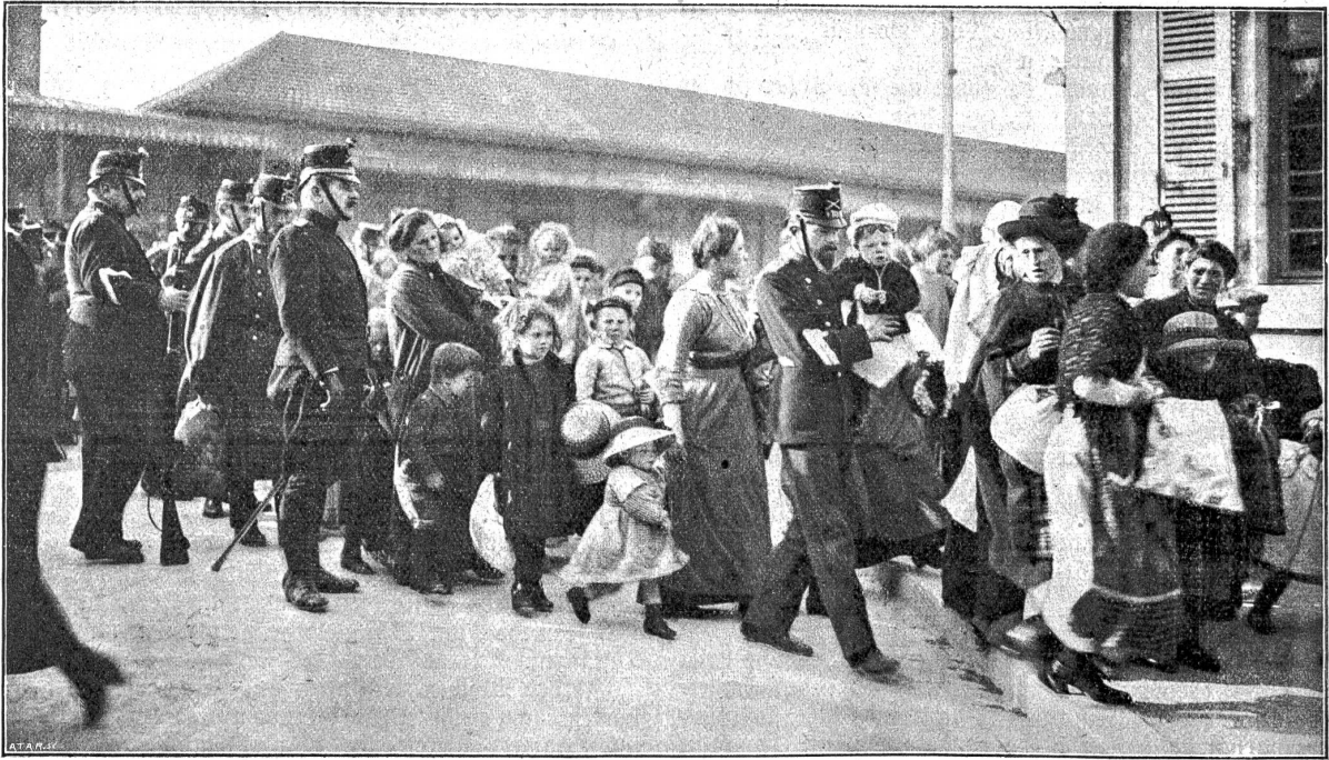
Transport von französischen Zivilinternierten durch die Schweiz. Die Internierten verlassen den Genfer Bahnhof Cornavin.

zu achten. Dies wurde uns erleichtert durch das Abhängigkeitsverhältnis, in dem wir zu unsern Gastgebern standen. Bald schuf die Natur zwischen uns eine allgemeine Herzensprache, die alle äußern Hindernisse überbrückte, und wir empfanden, daß es nur den Schritt des Entgegenkommens braucht, um die Rassenfeindschaft zu zerstören. Wer den tut, beweist mit der Tat, daß ihm höher als die Nation die Menschheit steht. —