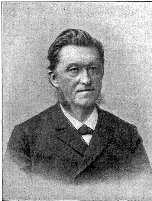
† Julius Thellung.

Letzte Woche erlitt der Dampfer „Stadt Thun“ kurz nach der Ausfahrt von der Station Gunten einen Radruck und konnte die Fahrt nicht fortsetzen. Das Schiff mußte zur Reparatur in den Dock verbracht werden und die Passagiere setzten ihre Reise per Schleppler fort.