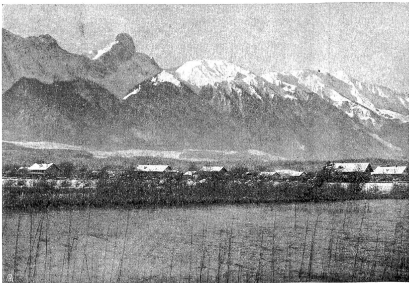
Ufer am Gwatt, mit Stockhornkette. Die Bebauung nähert sich dem See immer mehr.

Sie wohnte mit ihrer Mutter in der kleinen Holzhütte am See und vermietete die Ruderboote. Sie war nie anderswo gewesen als am See. Ihr ganzes Leben lang. Sie liebte ihn und verstand all seine Regungen und Schönheiten. Am Morgen galt ihm der erste Gruß, dafür