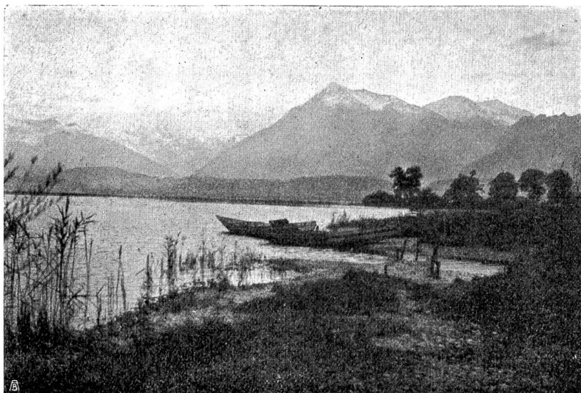
Blick auf den Niesen vom Naturufer aus.

sangen sie seine Wellen des Nachts in Schlummer ein. So kam es, daß sie den Doktor auch hier am See zum ersten Male sah. Das war im Frühling vor zwei Jahren, an einem warmen, goldigen Nachmittage. Er kam so, wie sie ihn nachher so manchmal noch sehen sollte: Den Hut in der Hand und unterm Arm ein Buch. Und die blonden Haare waren wohl ein wenig wild und ungestüm. Sie aber sah nichts als die blauen Augen. Denn die überstrahlten das ganze Gesicht und waren tief und mild. Sibylle liebte diese Augen. Alle Seligkeit der Erde und des Himmels schien ihr darin verborgen zu sein. Wenn sie in den See hinausruderte und der ganz blau und ohne Ende war, dann sagte sie: Du bist schön. Aber ich mag dich nicht mehr. Denn ich liebe nichts auf der Welt als seine Augen. Oft saß sie stundenlang auf der Bank vor der Hütte und legte die Hände vors Gesicht. Damit kein fremder Eindruck sie störte, damit sie allein war mit dem Heiligtum dieser machtvollen Augen.