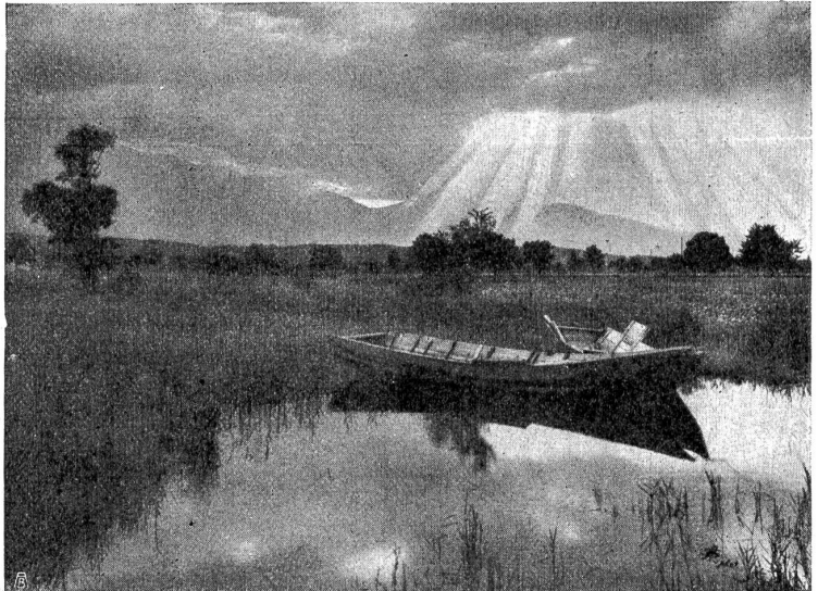
Partie bei Dürrenast am Chunersee.

Und als sie auf die Höhe eines großen schneeigen Kirschbaumes kamen, sagte der Herr Doktor: „Seht Ihr, Sibyll, dort unter dem marmornen Blütendache bereite ich alle Tage meine Schulstunden vor.“ Sie dachte, daß er den jungen Herren Herrliches erzählen müsse. Und zu-