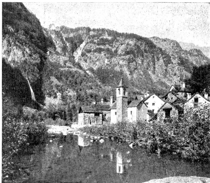
Ritorto im Val Bavona.

Und kam dann neue, vorwärtstreibende Erde- und Lebensfreude über mich, den Himmelsucher auf Erden, den Himmelfinder im Val Bavona, in San Carlo, am Monte Basodino.