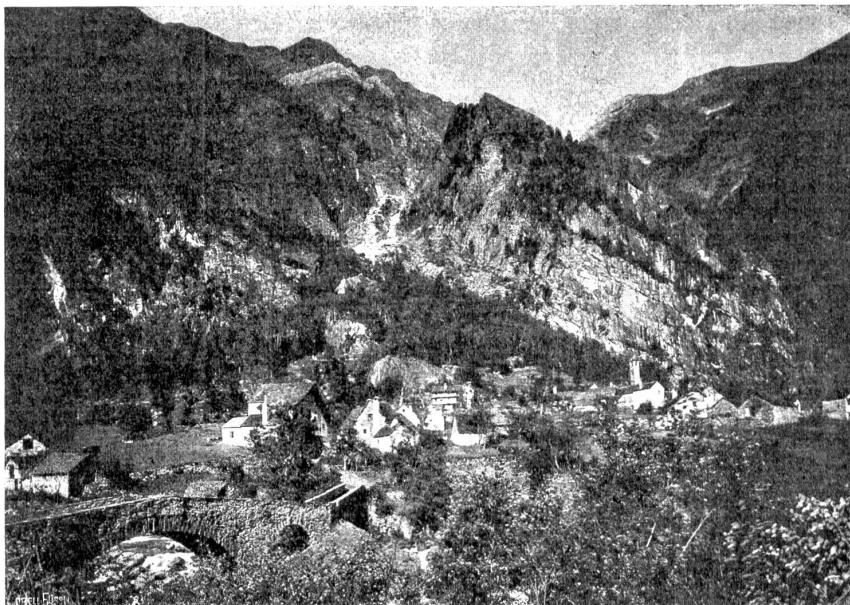
San Carlo im Val Bavona.