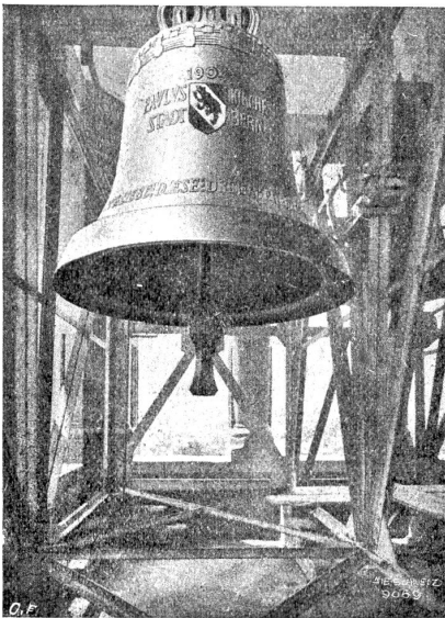
Glode in B in der Pauluskirche in Bern (Gewicht 3435 kg) aus der Gießerei H. Rüetschi in Aarau.