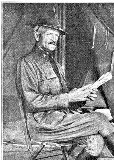
John J. Pershing,

der Front südlich Zborow eingedrückt, zahlreiches Material aus den Gräben geholt und Gegenangriffe abgeschlagen. Die Vorstöße auf Brzezany hatten anfänglich Erfolg, endeten aber mit der Vertreibung der in die Gräben gedrun genen Russen. Gegenwärtig wütet auf denselben Fronten eine heftige Artillerieschlacht. Im Arbeiter- und Soldatenrat wurde mit \frac{2}{3} Mehr eine Glückwunschartik an die Tätigkeit der Armee beschlossen. Rußland horcht auf. Alle Reden Kerenskis stellen die Lage als höchst gefährlich dar; so die der Infanterieattache vorausgegangene Proklamation. Der Feind wird darin von neuem als der Verräter hingestellt, der Separatfriedensversuche unternahm, um dann zuerst im Westen, hernach im Osten zu siegen. Wie nun aber auch die Offensive zustande gekommen sei, aus der Not der Revolution ward sie geboren; die Befürworter des Krieges glauben an ihre Notwendigkeit ebensowehr, wie die Friedensfreunde im Kriegsende allein die Rettung der Bewegung suchen. Und die Revolution ist in Gefahr. Vielleicht beinahe weniger bedroht von Deutschland als von England, das mit allen Mitteln den vorzeitigen Friedensschluß zu verhindern sucht, einen Separatfrieden der Revolution mit dem Gegner aber nicht ertragen kann. Schon wurden Stimmen laut, die von einer Wiederaufrichtung des Zarentums seitens Englands sprachen. Was hält die Diplomatie Sir Buchanans zurück, im