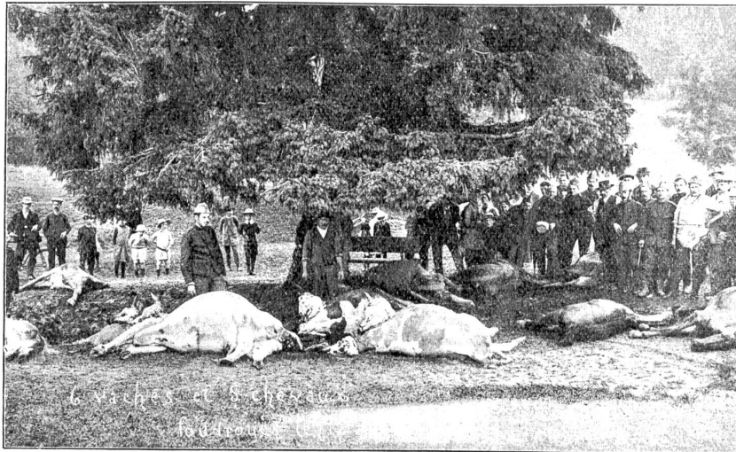
Ein schrecklicher Blitzschlag im Jura.

Herr Bundesrat Ador hat am 2. Juli sein Amt als Chef des Politischen Departements angetreten.