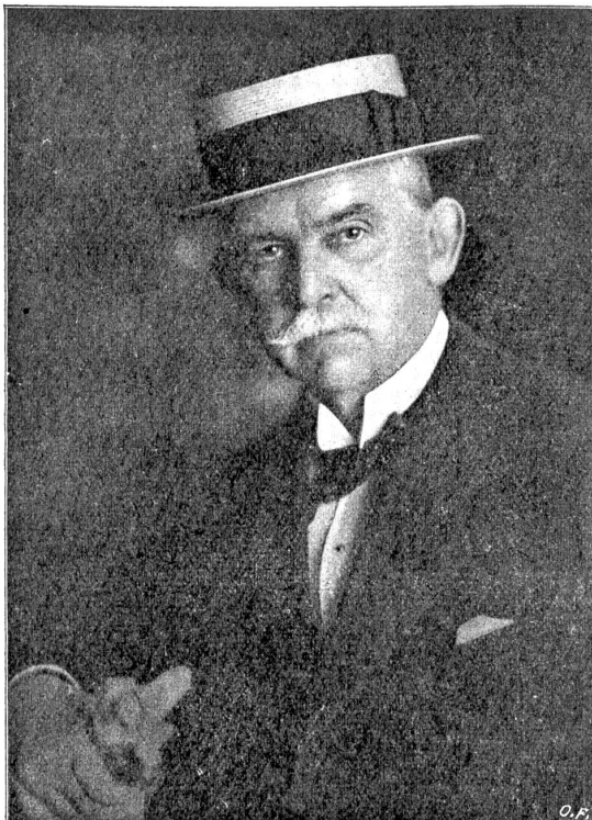
Oberst Pleasant A. Stovall,

Die sozialdemokratische Partei hat die Volksinitiative für eine direkte Bundessteuer ergriffen. —