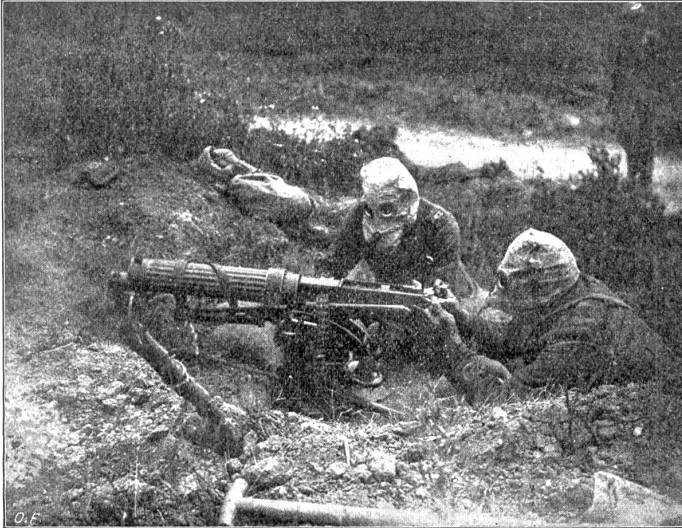
Geschützmannschaft mit der Gasmasken.

er denkt, dem Kerl kann ich nichts vormachen. Sag: Lieber, zu ihm. Lieber darf sonst niemand zu ihm sagen. Er sagt's nämlich den andern. Zude die Achseln. Schweige. Laß ihn sich den Mund abschleifen. Greife nie zu nach einem Angebot. Laß ihn darum betteln. Nimm immer, denn du bist es, der gibt. Vergiß das nie. Verstehst du mich, du Milchbart." Martin nickte schwach zum Zeichen der Zustimmung.