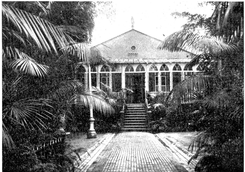
Das Museum Göldi in Pará.

studiert an der dortigen Hochschule. Nach einem Jahr öffnet sich ihm eine Lehrstelle in Jena; so kommt er zu Professor Häckel, wird sein Schüler und bald sein Assistent. Zur Vertiefung seiner Studien geht er nach Leipzig und Berlin