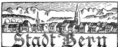
† Hermann Steiner, gew. Photograph in Bern.

Der Katastrophe sind auch mehrere Menschenleben zum Opfer gefallen, man spricht von 8 Personen, darunter Herr Bucher, alt Briefträger. Ein Haus „Kornhüsl“ genannt, stürzte ein; 3 Personen und die Viehhabe wurden unter den Trümmern begraben. P-t.