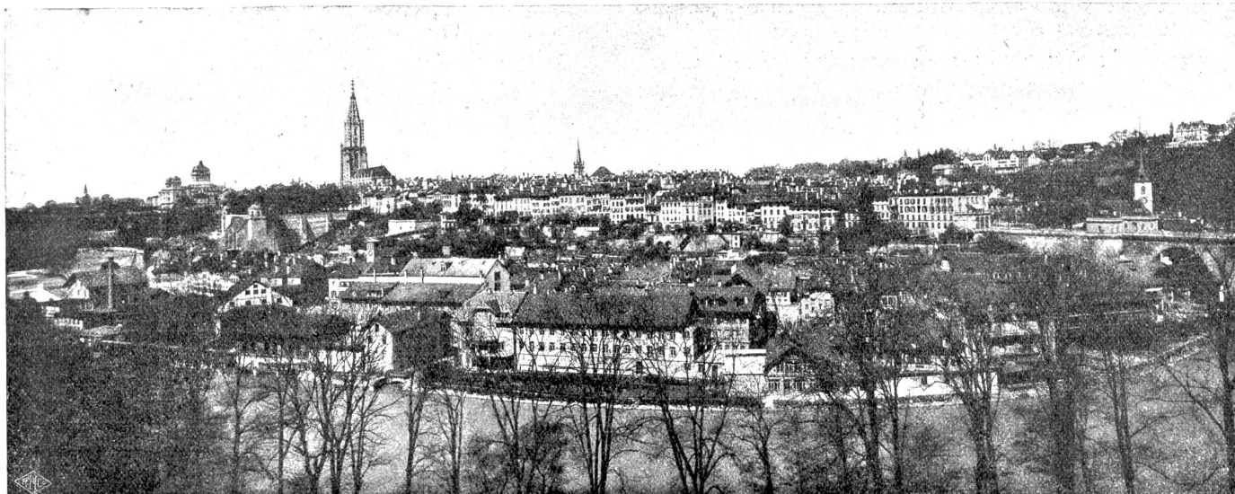
Ansicht der Stadt Bern vom Muristalden aus.

dären Bewegung errichtet, und man kann noch auf der Vorderseite eine in Altdeutsch gehaltene Inschrift lesen: Alhier haben sich die Herren Eidgenossen versammelt... Oft, Sonntags, gingen wir im Wagen zum Frühstück nach Laupen, in dieses Nestchen, dessen Namen an eine andere Schlacht erinnert. Wir kamen in den Wald; mein Vater verfehlte nie, mit der Peitsche auf einen Grenzstein weisend, scherzhaft auszurufen: „Jetzt sind wir in Bern!“ Dann kamen wir bei der Sense an, und, über der gedeckten Brücke angelangt, deren Balken unter den Rädern wackelten, bemerkten wir, an den runden Hügel angeklebt, die kleine Stadt und auf den Mauern des Schlosses das riesengroße Wappen der gnädigen Herren. So kam ich dazu, beständig Bern als den geheimnisvollen Mittelpunkt zu wähen, durch die Wälder durch, über die Flüsse weg, an den Hängen der blauen Hügel, der sämtliche üechtländische Strahlen in sich vereinigte; — ich wähte es mit Kriegeren und mit Staatsmännern bevölkert, und Berns Name klang in meinen Ohren wieder gleich einem Kanonenschuß, einer Batterie Tambouren.