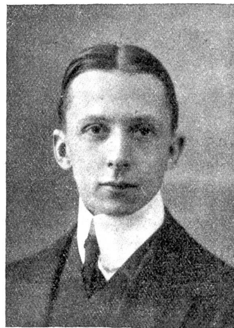
Dr. Gonzague de Reynold.

fuhr man über zwei Brücken und einen Tunnel: ich hatte Angst, und mein Vater rief, um mich zu beruhigen, Zündhölzer an. Welche Bangigkeiten und welche Freuden! — Bern ließ sich in einige konkrete Begriffe zusammenfassen: ein weißzudriger Bär mit roter, herabhängender Zunge auf einem Lebkuchen; ein Bär aus Silberpapier in einer großen Glaskugel; eine Trommel, die man mir kaufte, auf der ich den Bernermarsch spielen lernte, und deren roter, mit schwarzen Flammen bemalter Kasten Namen und Datum der Schlacht von Neuenegg trugen. Ich hatte einen Onkel — er war Soldat, Sie kennen ihn —, der mir Geschichtsstunden gab, der mir die alte Schweiz offenbarte. In Bern hatte er mich in das Museum geführt. Er hatte mir die Statue des aufrecht stehenden, barhäuptigen Bubenberg gezeigt — die eines Rudolf von Erlach, der, auf einem kleinen Pferd reitend, das mich mit Reid erfüllte, das Banner schwenkte. Meine Eltern wohnten im Sommer in einem Dorf, das an