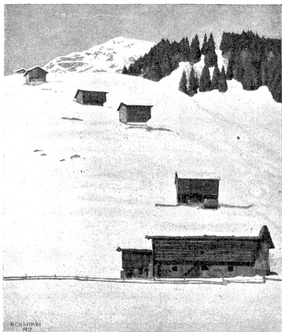
Plinio Colombi: Winterlandschaft (Öelgemälde).

Colombi hat sich auch mit Erfolg in den graphischen Künsten versucht; er hat Holzschnitte, Lithographien, Radierungen geschaffen. Leider können wir unsern Lesern kein Beispiel vor Augen führen. Wir begnügen uns darum mit