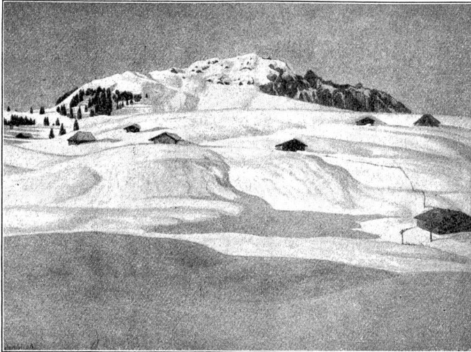
Plinio Colombi: Partie vom Bruchpass (Ölgemälde im Museum Basel)