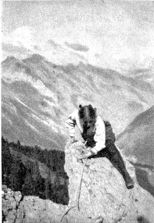
Bergerinnerungen. — Damenklettere.

nacht gefungen und getanzt wird, ist's für Fräulein nicht zünftig genug zugegangen.