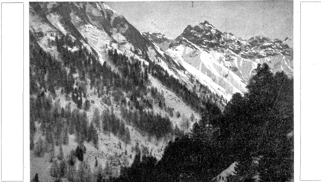
Aus dem schweizerischen Nationalpark: Das Val Trupchum mit Piz Sier.

often grüht in ihrer strahlenden Schönheit die Ortlergruppe hinüber. Ein entzückenderes Bild von großartigerer Wirkung kann man sich gar nicht denken. Viel Schönes in Nord und Süd habe ich schon gesehen. Aber wenigstens reicht auch nur bei weitem an den wunderbaren Ausblick auf dem Murtèrgrat. Greifbar nah erscheinen diese italienisch-österreichischen Grenzberge. Daß der Krieg auch über sie Hand gelegt hat, beweisen die dumpfen Kanonenschläge, die in fast regelmäßigen Intervallen ständig herüberbönen.