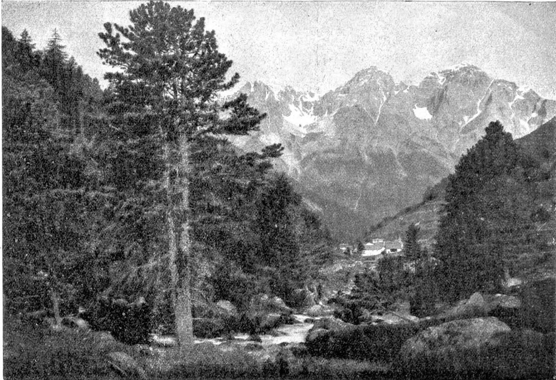
Aus dem schweizerischen Nationalpark: Partie aus den Scarltälern.

den schönsten Schluchten der Schweiz an die Seite stellen darf. Die Schlucht ist passierbar. Der Fahrweg allerdings klettert in anfänglich steilen Rehren über die rechte Talseite. In drei Stunden gelangt man zum Weiler Scarl, in dessen Nähe die drei Tälchen des Nationalparkes, Mingè, Foraz und Tavrü abzweigen. Man gelangt auch auf anderem Wege hin, nämlich durch das Paralleltal des Scarl, durch das Val Blavna. Auf hoher, stolzer Aussichtswarte, weit hin grüßend, steht das Schloß Tarasp, das herrliche, vom Odolfkönig Dr. Lingner gründlich renovierte Baudenkmal.